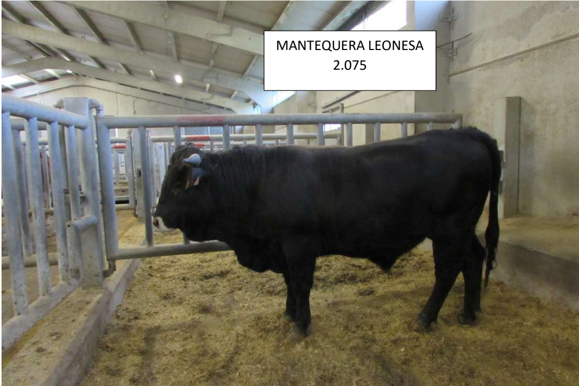
MANTEQUERA LEONESA 2.075