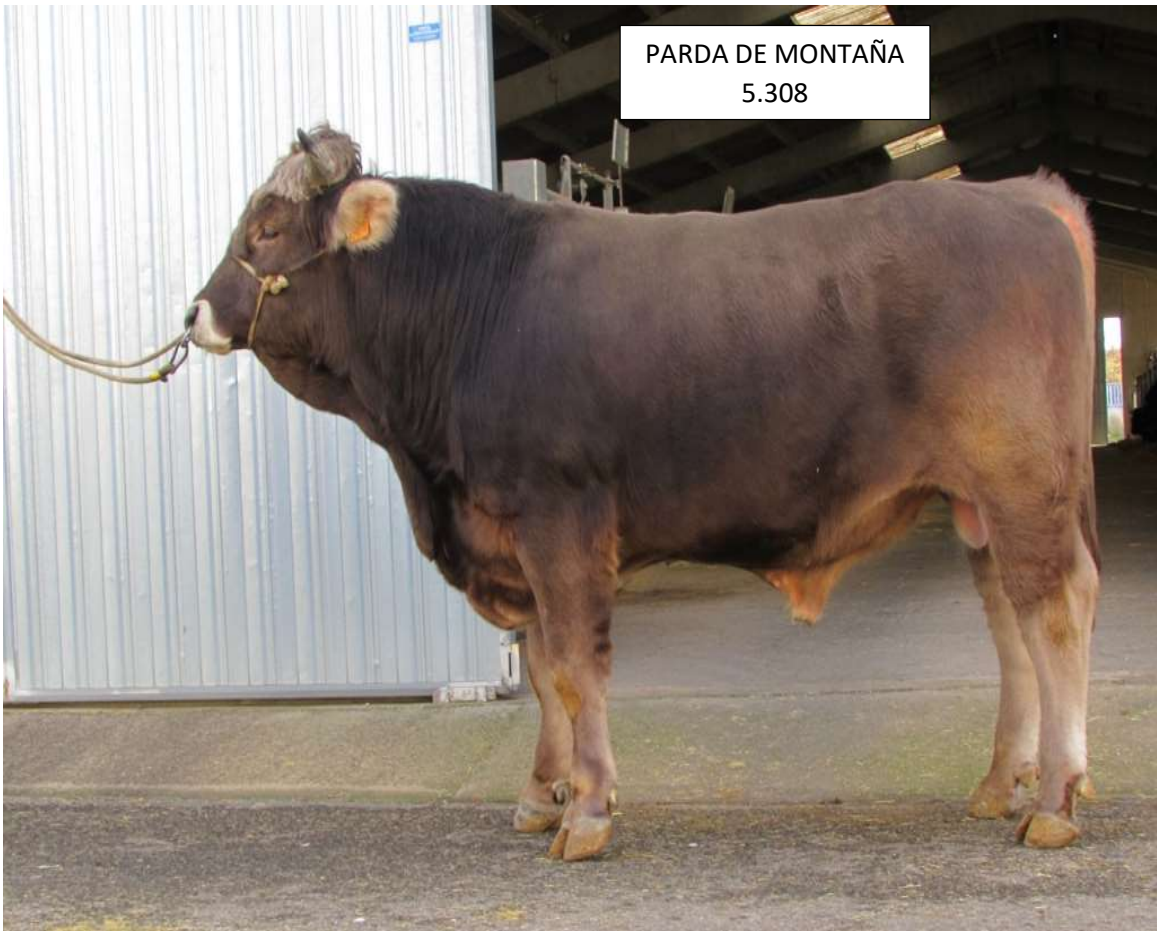
PARDA DE MONTAÑA 5.308